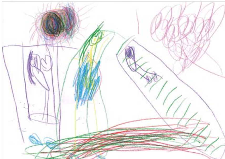
「ブランコとすべり台」 かわた さな (4) みんなで楽しく遊ぶ気持ち