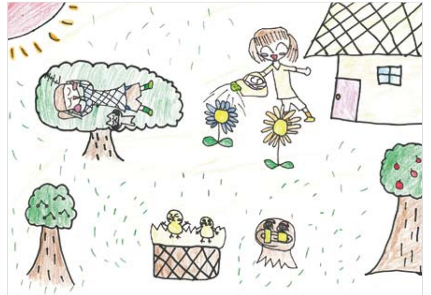
「楽しいにわ」 丸山 千陽 (9) 鳥がいたり、こびとがいたり、 木のベッドがあつたり、楽し いイメージを思いうかべて書 きました。