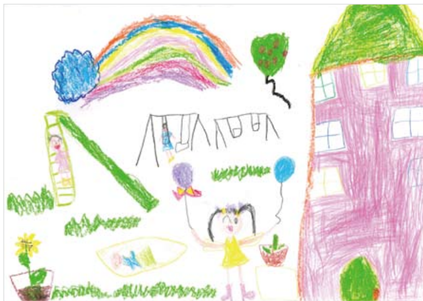
「きょうだいほしいな、お庭 であそぼ」 丹野 穂乃香 (5) 一人っこのので、きょうだい がほしいです。ブランコなど 公園のように遊べるお庭がほ しい。花やみどりに囲まれて 夢をのせたふうせんを赤ちゃ んに見せて遊びたいなあ