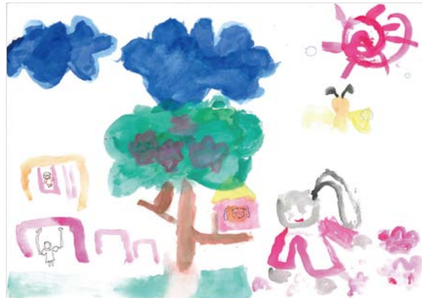
「大きな木のある庭」 石岡 奏 (6) 楽しい気持ち