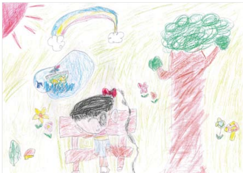
「しぜんのおにわ」 あまない ゆみ (5) しぜんにすごしてほしいから