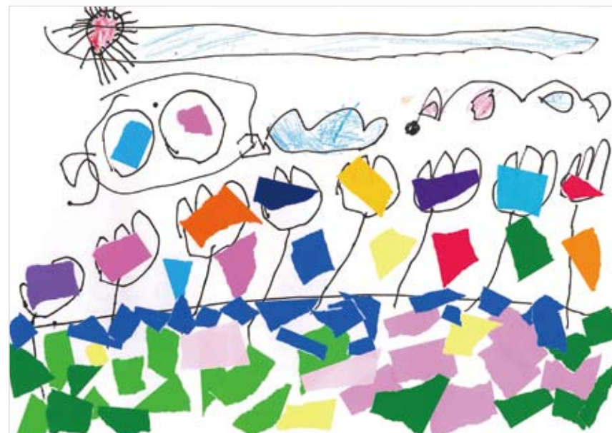
「おはながパッとひかったよ」 のざわ みさ (4) お庭のお花がお水をのんで、 パッと光り、明るくなった庭 にちょうちょ達があつまってきました。