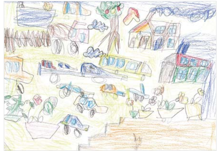
「広いお庭」 新谷 南法吏 (4) ドキドキしながら書いた。