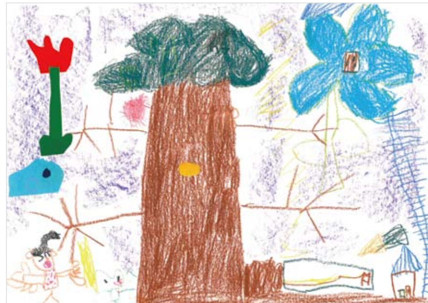
「おべんとうのじかん」 平澤 香澄 (5) たのしいきもち。ペットをか いにいったあとに、おにわで おべんとうをたべた。