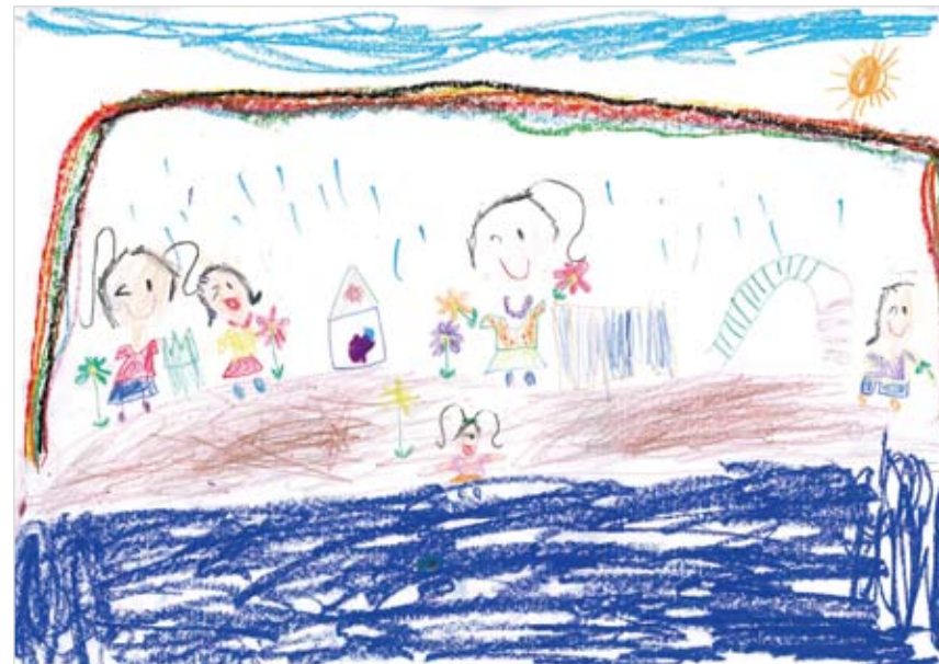
「おいしいお庭」 熊谷 悠杏 (5) お庭は食べ物でできています。土はクッキー、池はブルーベリーのジュース。友達が集まってきたから、これからお花を摘んでお鍋で煮てジュース作り。まん中にいる私は 池にカメラを落としてしまったけど虹がきれいだからハッピーです。