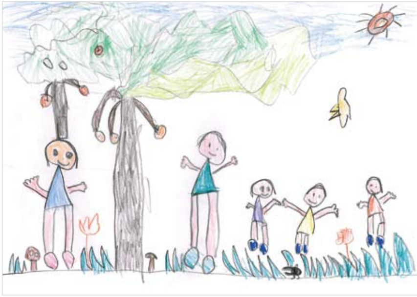
「家族の庭」 間山 真 (5) 家族みんなで庭で楽しく遊びたい