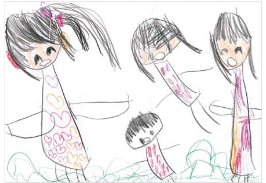
「家族」 小鹿 瑞姫 (4) 楽しい家族の様子を書きました。