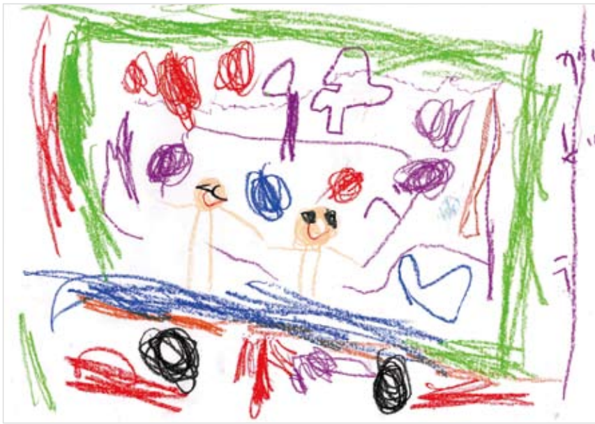
「ままとあそんだよ！」 まつやま がどう (5) 仕事ばかりでなかなかあそべないママと広いお庭で楽しくあそんだ。その中に大きな虹が出来てたよ。