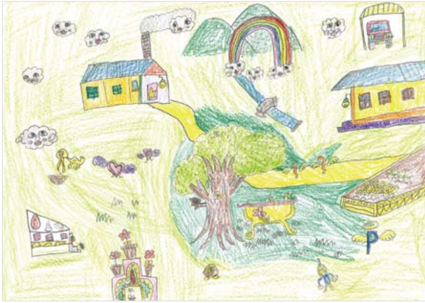
「不思議なお庭」 新谷 吏輝太 (7) きれいなお庭があったらいいなと楽しい気持ちで書いた。