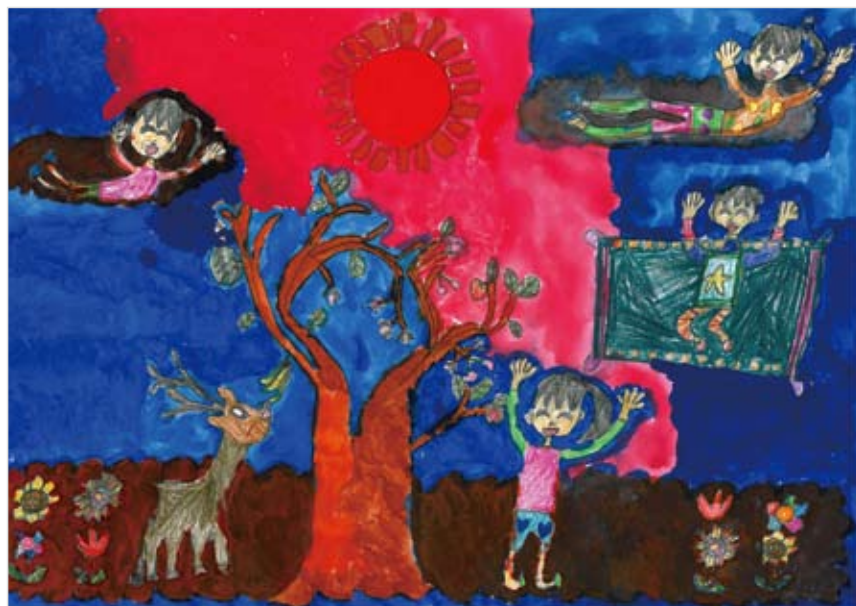
「くもの上 楽しいな！」 平澤 葵 (8) くものおにわをかいたり え のぐとかでぬったりして と てもおもしろかったし、また やりたいです。