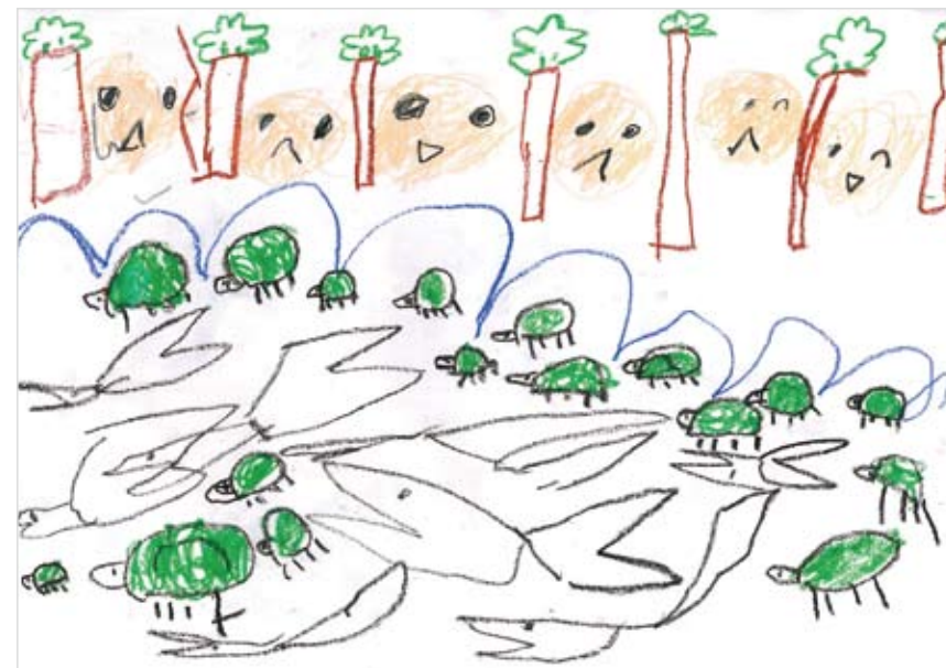
「みんな なかよし」 いけだ はやと (5) さかなつりもできる おにわが いいな