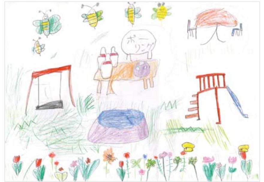
「ゆめのお庭」 中山 ゆずき (5) みんなとっしょに、なかよく遊びたいな。