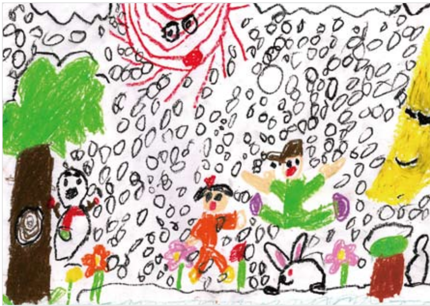
「きれいな たのしい おに わ」 本間 創伊 (6) 朝と夜と雪の日は、一度に全 部たのしめるお庭があったら いいな！という気持ちで作 りました。