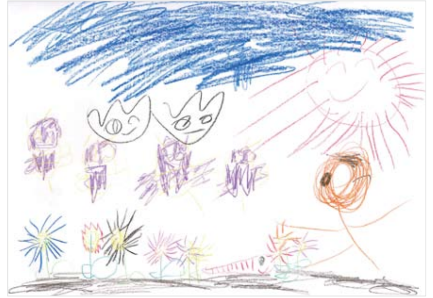
「おはなおおきくなったなあ」 せいとう たいが (5) おはながおおきくなって、お かあちゃんがうれしいだろう なあとおもってかきました。