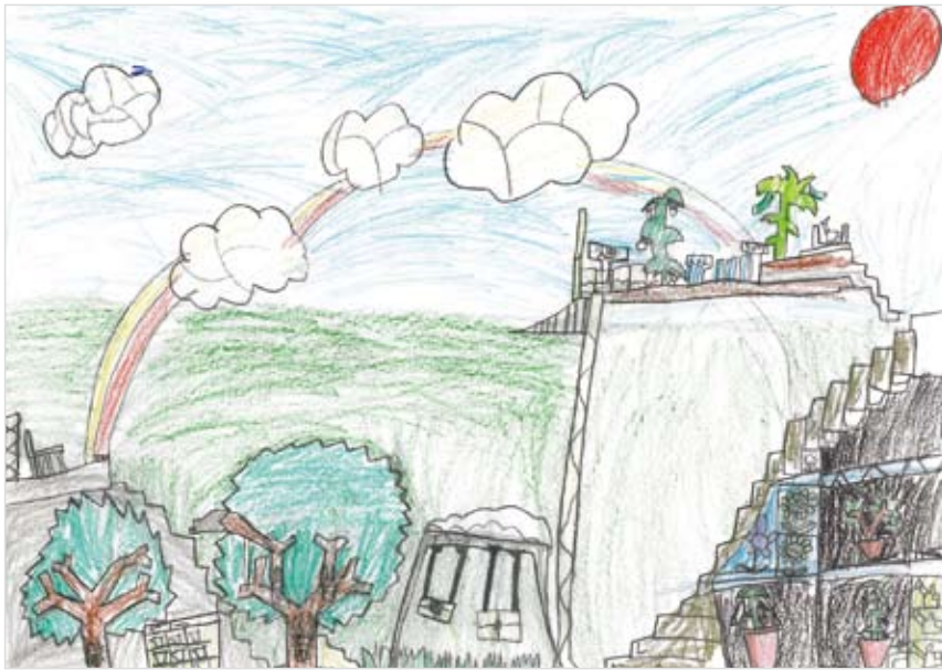
「木やみどりや花がいっぱいの森」 里村 駿秀 (8) いっしょうけんめい作った。おうちにクワガタやカブト虫がいればいいと思った。