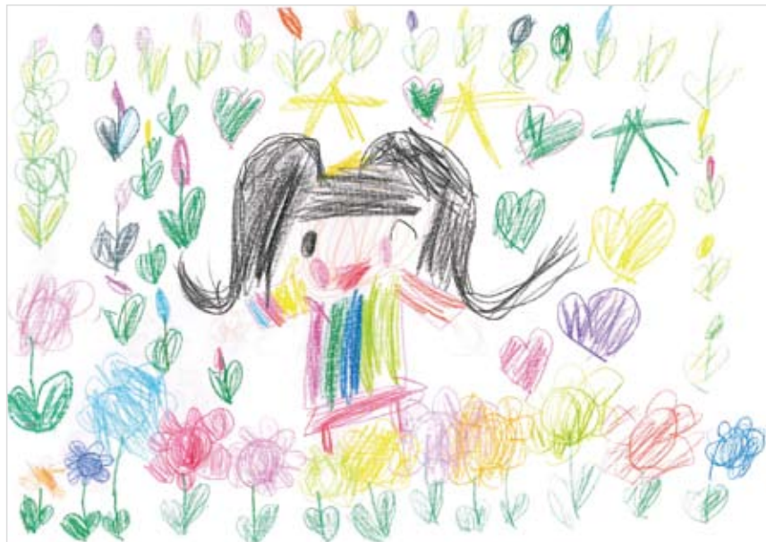
「お花畑とわたし」 古川 愛佳 (5) お花畑で遊んだ時を思い出して描きました。