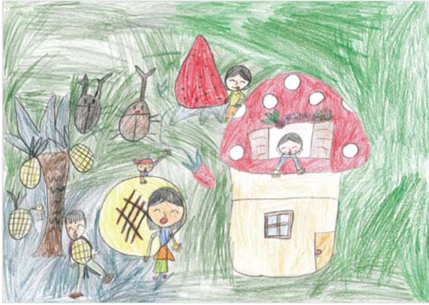
「かぞくのゆめのひろば」 くらうち はる菜 (8) 家族の好きな食物やかわいい 虫、やってみたい事を考え、 楽しい気持ちでかきました。