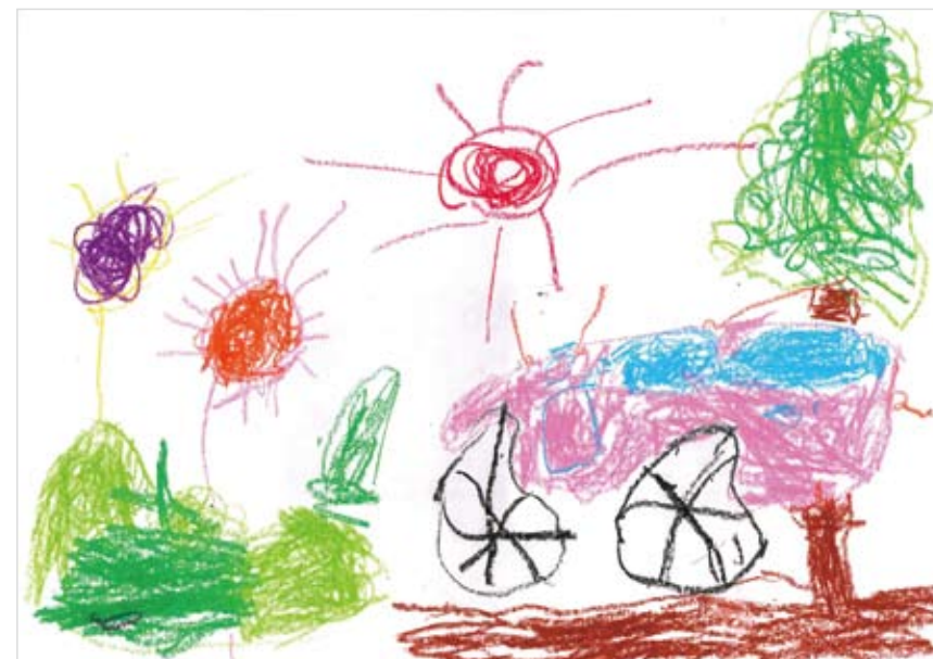
「くるまもおにわもピカピカ」 じん ゆうと (4) 「大好きな車がいっぱいある お庭がいい!」と言って書き はじめていました。