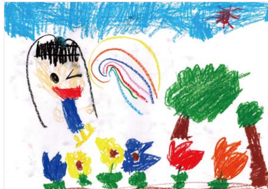
「にじのおはなばたけ」 かわぐち もみじ (5) すきなおはなをいっぱいかきました。