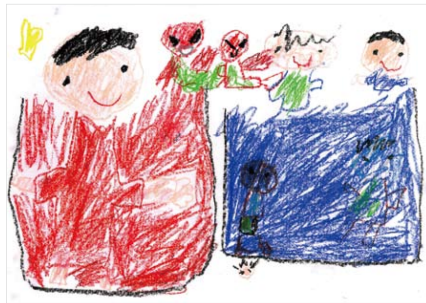
「恐竜と温泉に入れたらいい なあ」 とよしま さくや (6) 恐竜くらい大きくなって、大 すきな温泉で一緒に遊びたい と思いました。