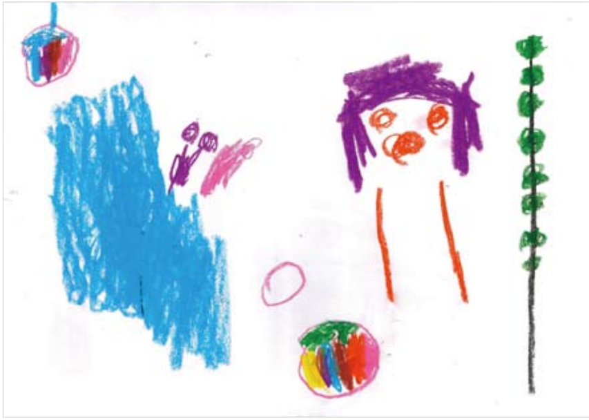
「楽しいお庭」 柳本 心菜 (3) 植物や動物がいるお庭で、たくさん遊びたいという気持ちで書きました。