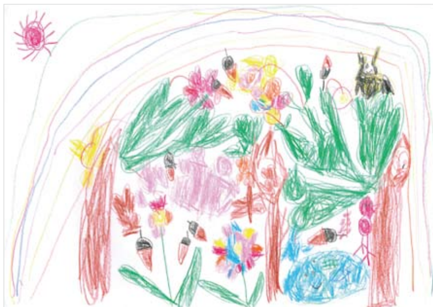
「ハートのおはなのもり」 かなや ひな (6) カラフルなおはなは、いいに おいがするかなあとかんがえ ながらかきました。