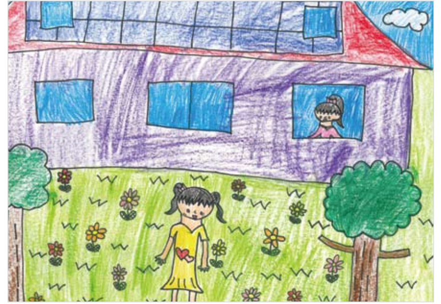
「いろいろなお花の庭」 黒滝 翠 (9) かわいい花がたくさんさいた 広い庭にいると楽しい気持ち になります。おうちの屋根に は太陽光発電つきでecoです。