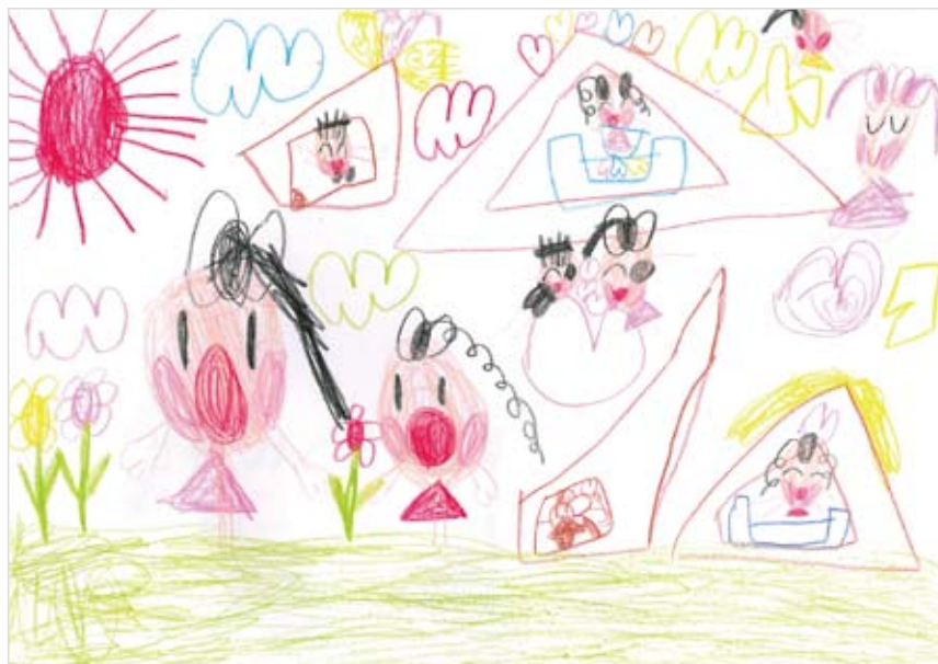
「お花ちゃん」 浅瀬石 百華 (5) 楽しい気持ちで書きました。