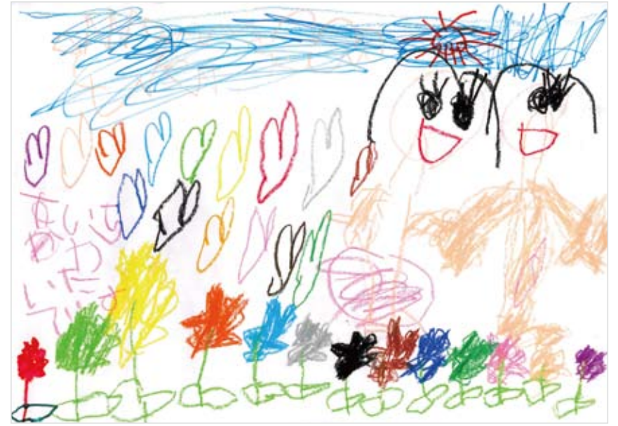
「こうなったらいいな…お家のお庭」 富田 愛来 (5) お家のお庭がお花畑になればいいと思って書きました。