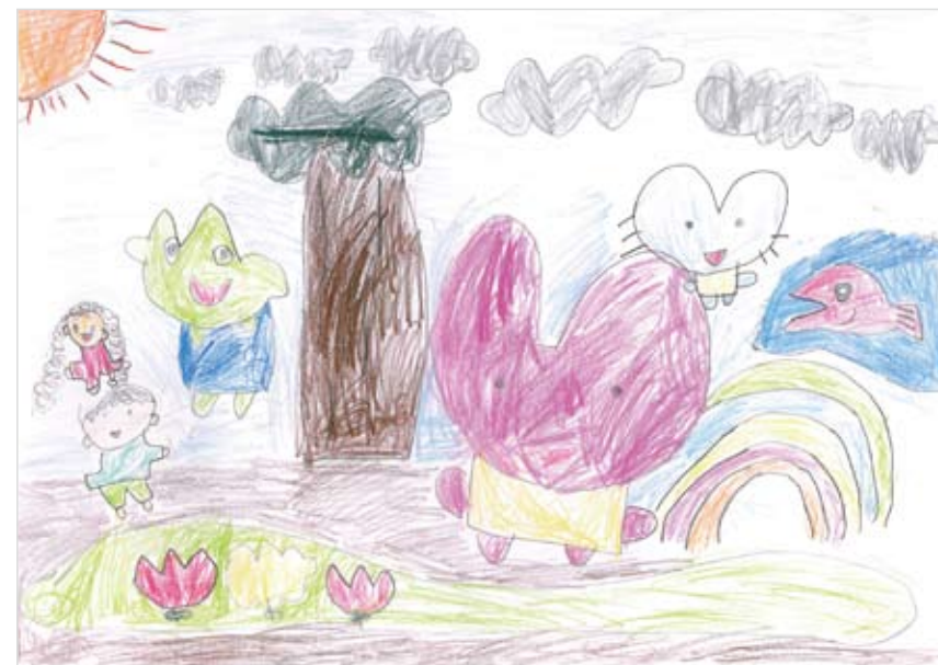
「みんなでオニごっこ」 梅田 彪真 (5) ひろ～いお庭で、大好きな動 物たちと鬼ごっこできたら楽 しいな…