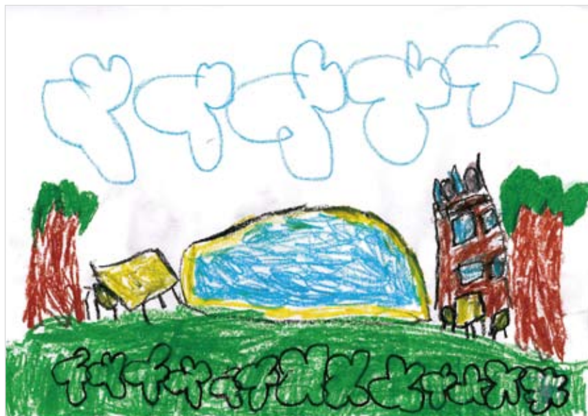
「みどりいっぱいのおしろ」 くどう ころろ (5) しょうらい、この絵のような 緑いっぱいのおしろに住みたい、 そして、ずっとずっとこんな みどりの地球が続いていく よう願いを込めて書いた。