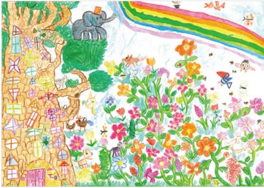
「どうぶつたちの花ばたけ」 小泉 悠 (6) じぶんでも、いろんな花をそ だてたい。