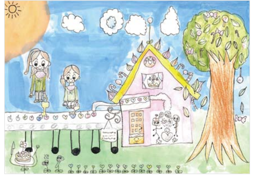
「おかしなお庭」 山館 美智子 (9) おかしをそだてて、いつでも おかしをたべれるおにわがあ ればいいなと思っておかし のお庭にしました。おかし のほかにも紅茶やスプーンも でできます。おかしの家から でてくるハートはおかしの たねです!!