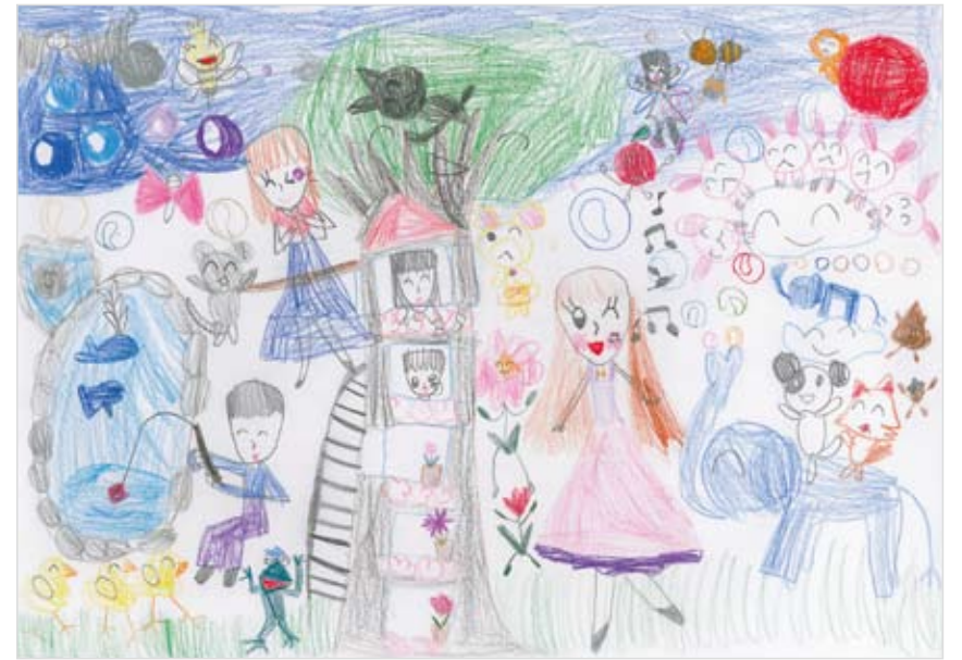
「いろんな動物と虫達の庭のダンサーズ」 倉内 ひかり (6) 私と家族が動物や虫たちと自由に庭で踊っている楽しい気持ち。お花も木も雲も虫も人間のようにぎっと心をもってるんだ！