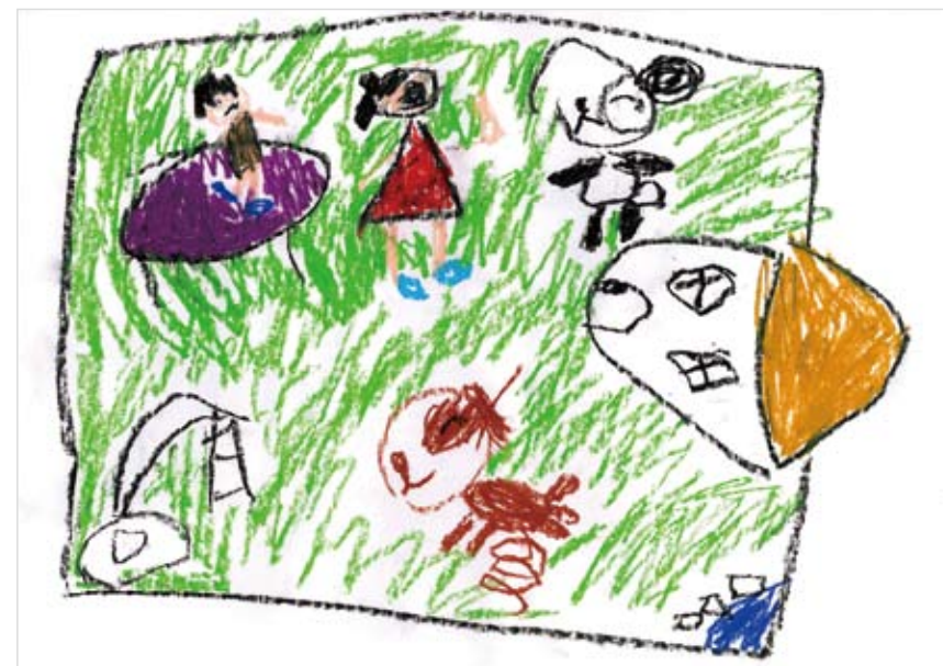
「どうぶつたちがいるおにわ」 鈴木 璃子 (6) おにわにだいすきなどうぶつ たちがいるとたのしいな