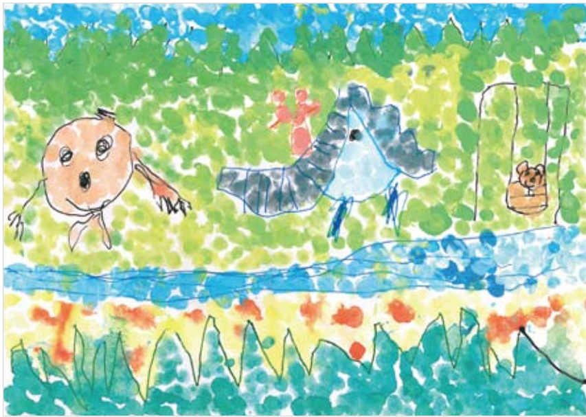
「どうぶつもあそびにくるぼ くのおにわ」 類家 慎吾 (5) ぼくのお庭は、お山の中に川 が流れる公園です。ぞうさん がやってきてすべり台になっ てくれました。うさぎさんと くまさんも一緒に遊びます。