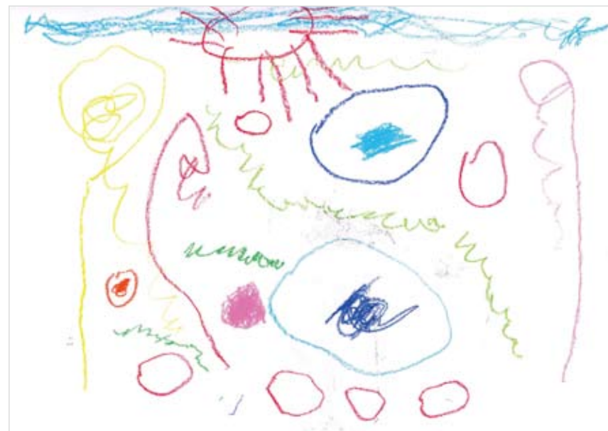
「庭と花火」 福井 翔太 (3) キレイなお庭がいいな