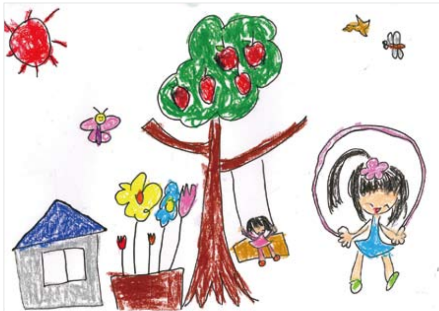
三上 夏帆 (6) 木のブランコあったら たの しいな。