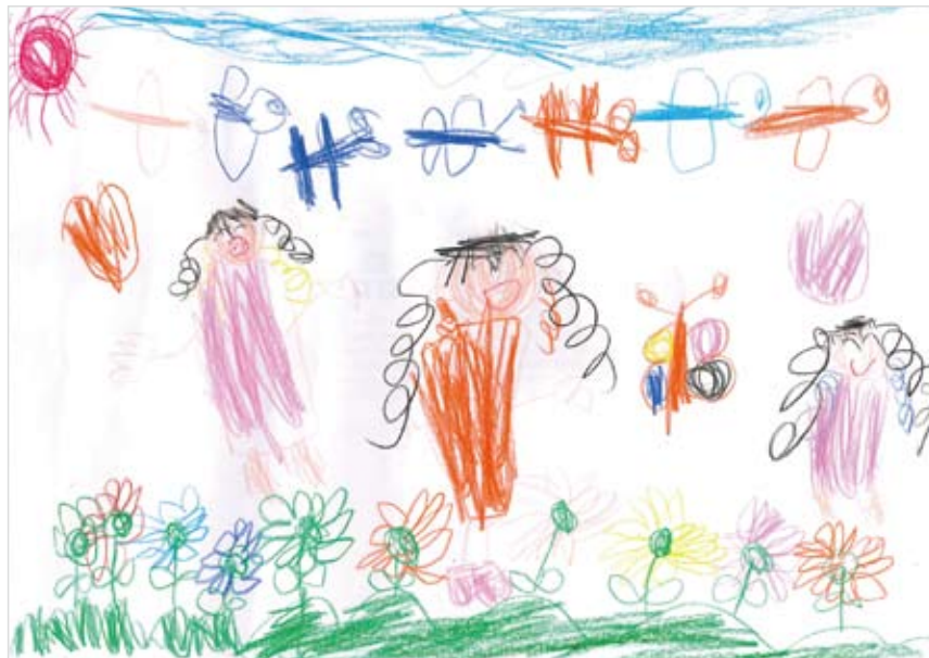
「お花だらけの庭」 阿保 杏奈 (5) お花やトンボを思い出してつ くりました。