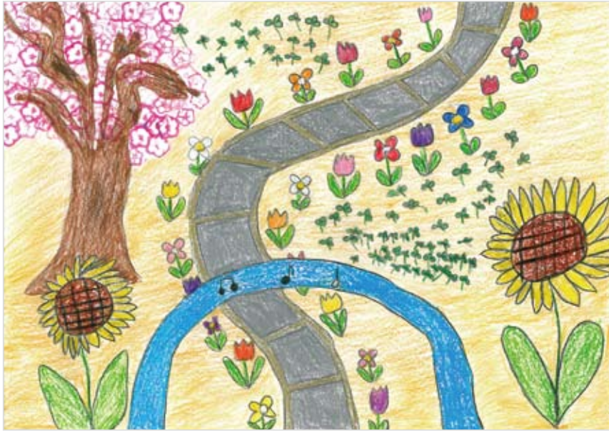
「花いっぱいでもいいにおい」 中川 裕斗 (8) おくらのスタンプをつくって、 さくらの花びらにしたところ を工夫しました。三つ葉のク ローバーの中に四つ葉のク ローバーも5つ入れました。