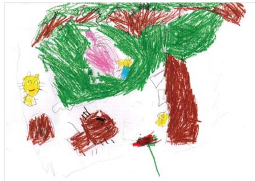
「楽しく遊ぶ動物達」 成田 光生 (5)