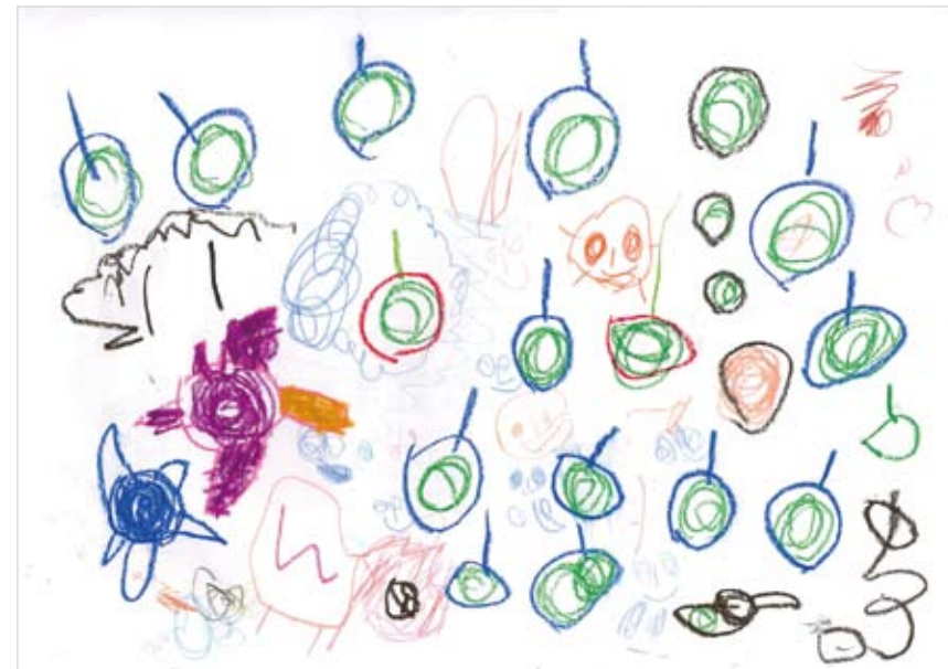
「りんごとおはな」 いしづか らん (3) りんごがたくさんおいしそう