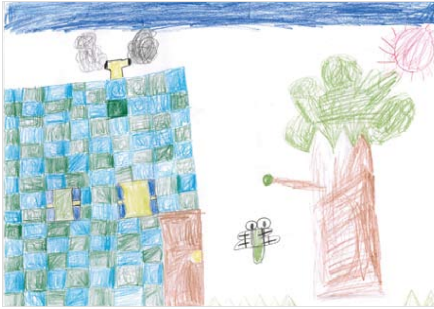
「ペットボトルの家」 山内 ゆうき (8) こんな家にすんでみたい気持ち