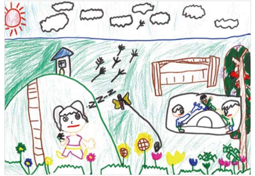
「おもいっきりあそべるおにわ」 ごのへ しんのすけ (6) だいすきなおねえちゃんやおともだちといっばいあそびたいな～というきもち