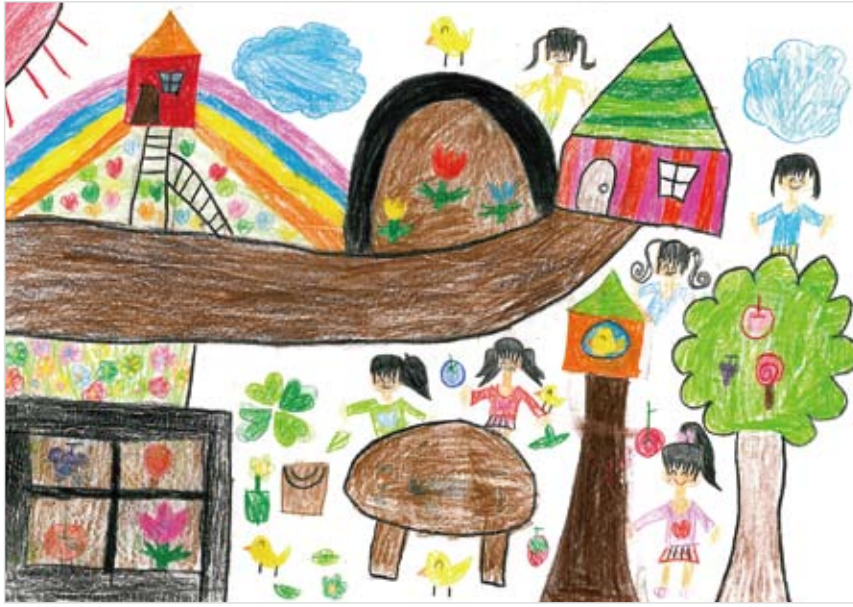
「おにわのパーティー」 白藤 詩子 (8) みんなでたのしいパーティー をしたから書きました。に じのおうちで、にじをいつ も見れます。