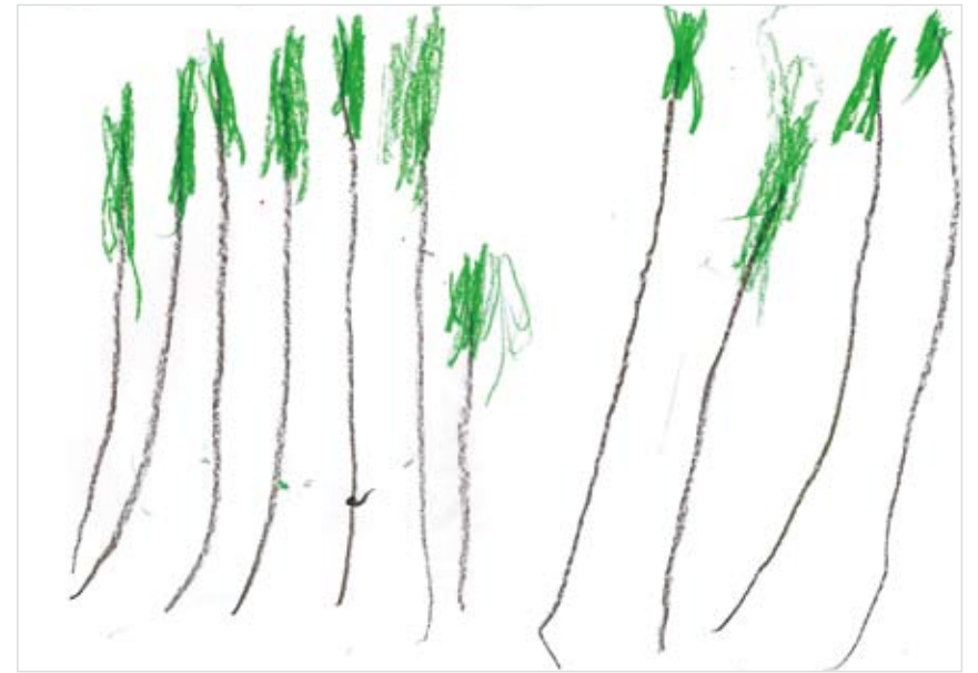
「木」 たつた たかおみ (5) 小さい木が大きくなっていく のをイメージして書きました。