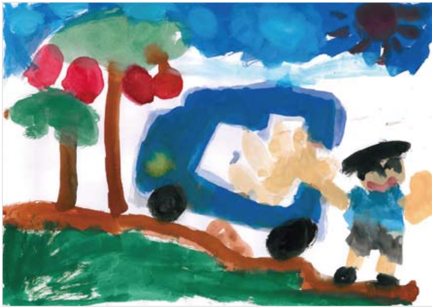
坂本 奏和 (5)