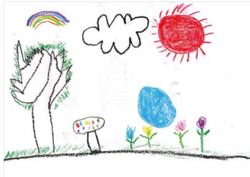
さとう あゆむ (6)