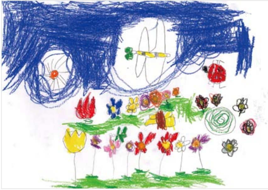
「ポンポン百日草と虫たち」 せきや そらひ (4) おじちゃんと百日草の種を 植えた事が、とても楽しかったのを思い出し、大好きな虫 たちもいっぱい書きました。