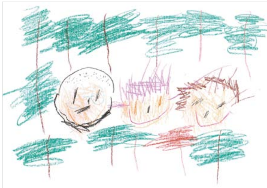
「とっとはやとママと木と木と木と…」 横瀬 颯人 (4) おでかけしたいと思って…