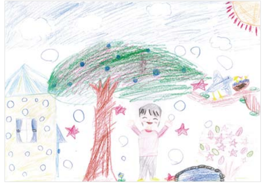
「自分だけの秘密の庭」 清藤 百花 (8) 夏に亡くなった、ひいおばあちゃんを思い出しながら書きました。