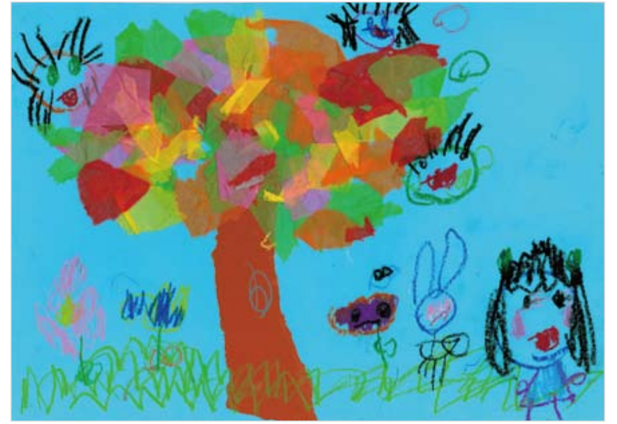
「お庭の木の上でかくれんぼしたいな」 宮本 彩菜 (3) 冬で今は家の中でしかかくれんぼができないので、暖かくなったら、お庭でかくれんぼをしたいです。大きくなったら木に登って大好きなかくれんぼをしてみたいです。