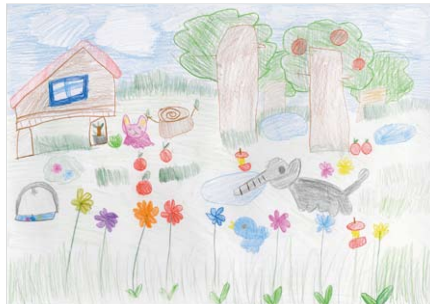
「みんなの森」 三浦 結月 (7) たのしいきもち。