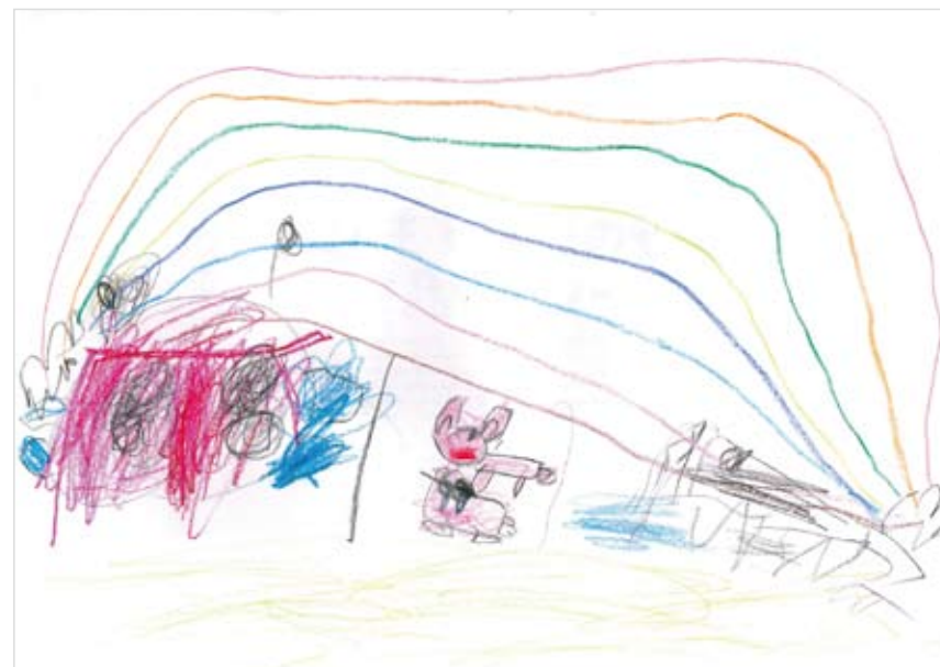
「にじ」 福井 将星 (4) 大好きなにじのお庭にしまし た。