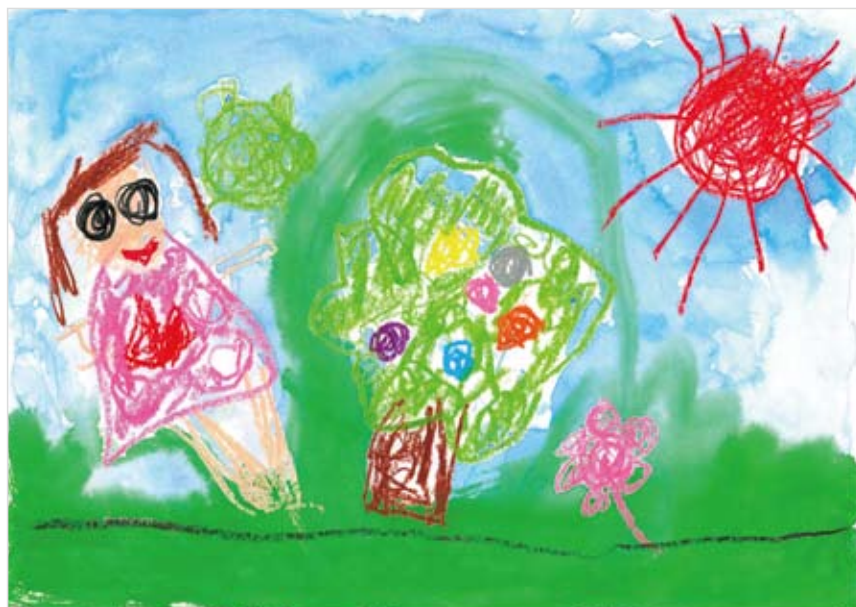
「木と私」 くどう るあん (4) 楽しそうに描いていました。