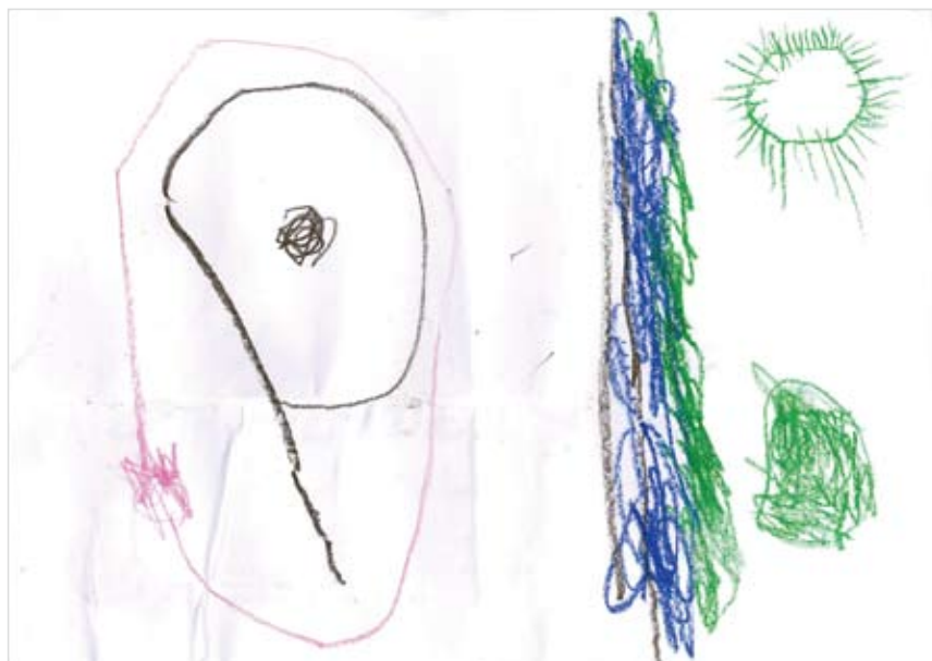
「天気の良い日のお庭」 富田 響希 (3) 天気の良い日のお庭を書きました。