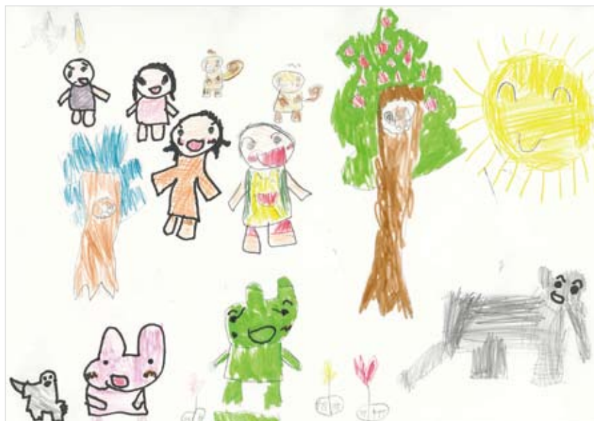
「たのしいおにわ」 さとう かなた (6) いいてんき みんなが ニコニコわらう たのしいおにわ