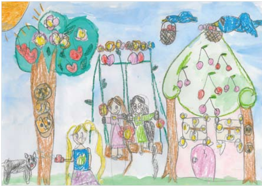
「わたしのおにわ」 やまだて たまこ (5) おにわにブランコがあったら いいなあとおもってつくりま した。たまこがあそんでいる とリスさんもねこさんもこ りさんもおともだちもみんな あつまってくるすてきなおに わだよ。