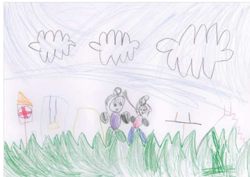
「私とママのお庭」 成田 穂花 (4)