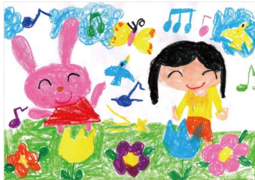
「たのしい たのしい音符の 庭」 にしや ひなの (5) たのしいキモチと動物たちと 歌をうたっている