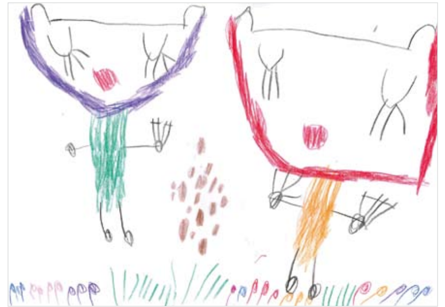
「おやすみなさい ハムスター」 小川 芽依 (4) ハムスターがお庭で しあわせそうに眠っているよ。ハムスターが食べる種やきのこもあるよ。