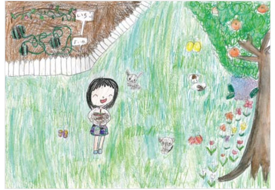
「楽しいおにわ」 奈良 さきの (8) かわいいおにわができるか なあと思ながらつくりまし た。うちのペットも楽しくあ そべたらいと思います。