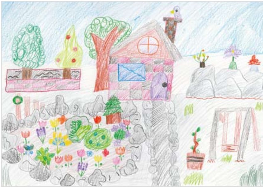
「わたしのすてきなすてきなおにわ」 五戸 茉莉 (8) わたしの家にも、こんなにすてきになるといいなあというきもち