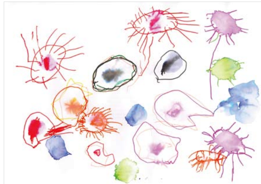
「空に浮かぶお花」 木村 晟 (4) シャボン玉で遊んだ後に描いたので、シャボン玉のように空中を好きな色の花が咲いているときれいだと言いながら描いていました。