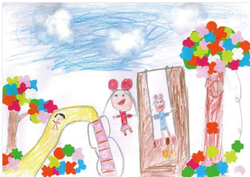
「遊園地のようなお庭」 阿部 梨乃 (6) 遊園地のようなお庭があったら、 毎日、お庭で遊べるなあ と思って作りました。