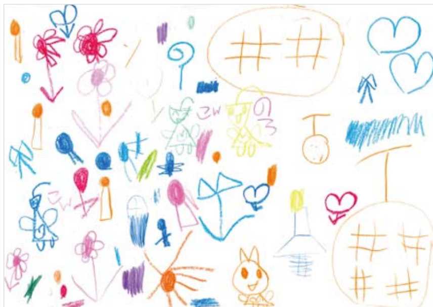
「遠足の思い出」 今 妃堯 (4) みんなが喜ぶかなあと思っ て、楽しい気持ちで書きました。